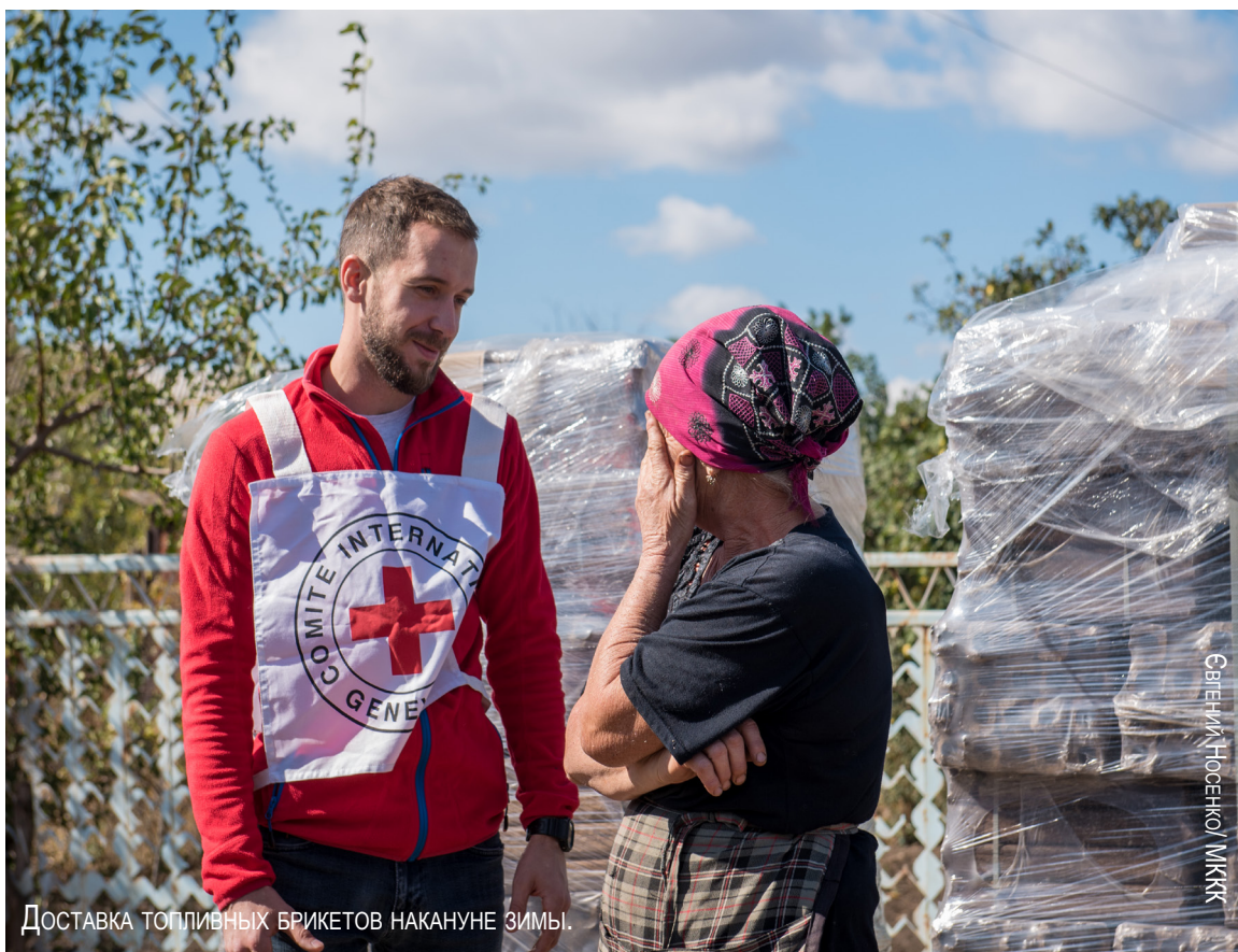
Доставка топливных брикетов накануне зимы.

От начала конфликта на востоке Украины прошло пять лет.