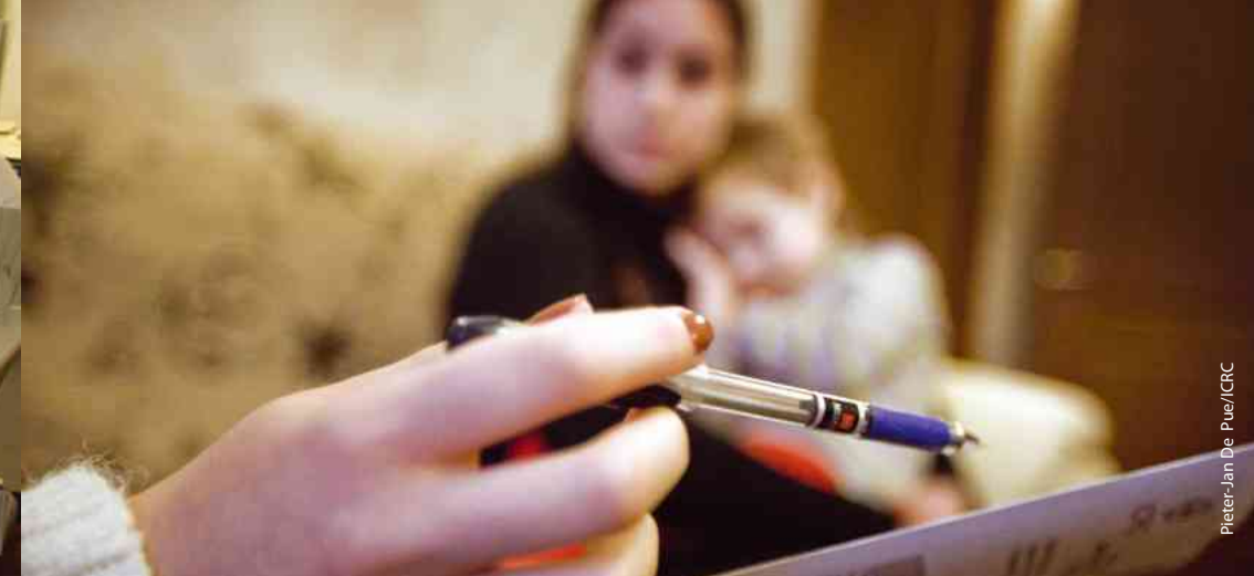
Pieter-Jan De Pae/ICRC