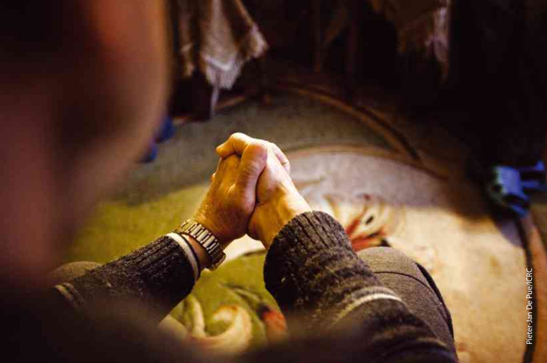
Pieter-Jan De Pue/ICRC