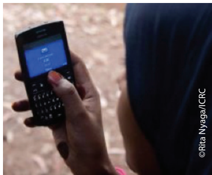
Fariin oo ICRC ah dhiirigelinaya hababka fayodhowrka wanaagsan