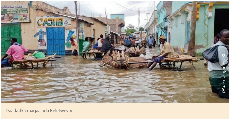
Daadadka magaalada Beletweyne

Waa fariin qoraaleed samata bixin karta nolol: “Ku dhaq gacmahaaga saabuun caruurtaadana u sheeg inay sidoo kale yeelaan.” Guddiga Caalamiga ee Laanqeyrta Cas (ICRC) ayaa waxay markii ugu horeysay fariimo teleefanka gacanta ugu direysaa in ka badan 20,000 dad ah oo ku sugan dalka Soomaaliya si ay si dhaqso ah ugu gudbisno tilmaamo ku saabsan ka hortaga daacuunka.