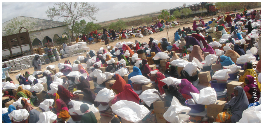
Qeybiska magaalada Beletweyne, Soomaaliya.

Nayroobi (ICRC), Daadad ka dhacay magaalada Beletweyne ee dalka Soomaaliya ayaa barakiciyey kumanaan dad ah kuwaasoo iminka u baahan cunno iyo biyo la cabbo oo nadiif ah. Guddiga Caalamiga ee Laanqeyrta Cas (ICRC) iyo Ururka Bisha Cas (SRCS) waxay gargaar deg degga ah u qeybinayaan in ka badan 30,000 qof si loo yareeyo dhibaatooyinka ka dhashay daadadka.