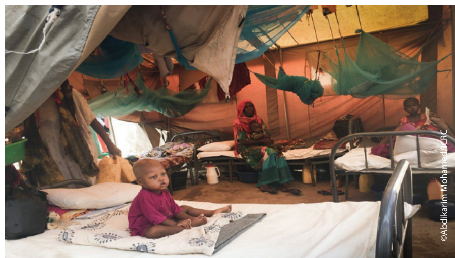
Mid ka mid ah teendhooyinka laga dhisay dibadda xarunta xanaanada deg degga ee nafaqo darida Kismaayo si loo dejiyo tirade badan bukaanada la keenay xarunta.