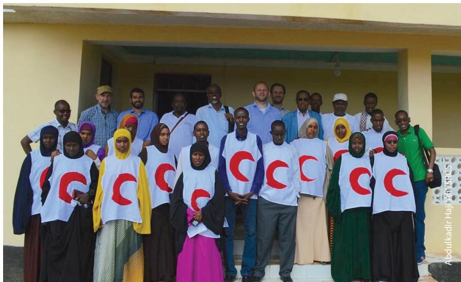
Sawirk koox ka kooban ICRC iyo SRCS oo ay la jiraan mutadawiciinta markii la furayey dhismayaasha cusub.