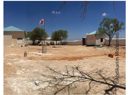
Halwo dhisme ka socota xafiiska SRCS laanta Xuddur. Dayactirka waxaa taageeray ICRC.