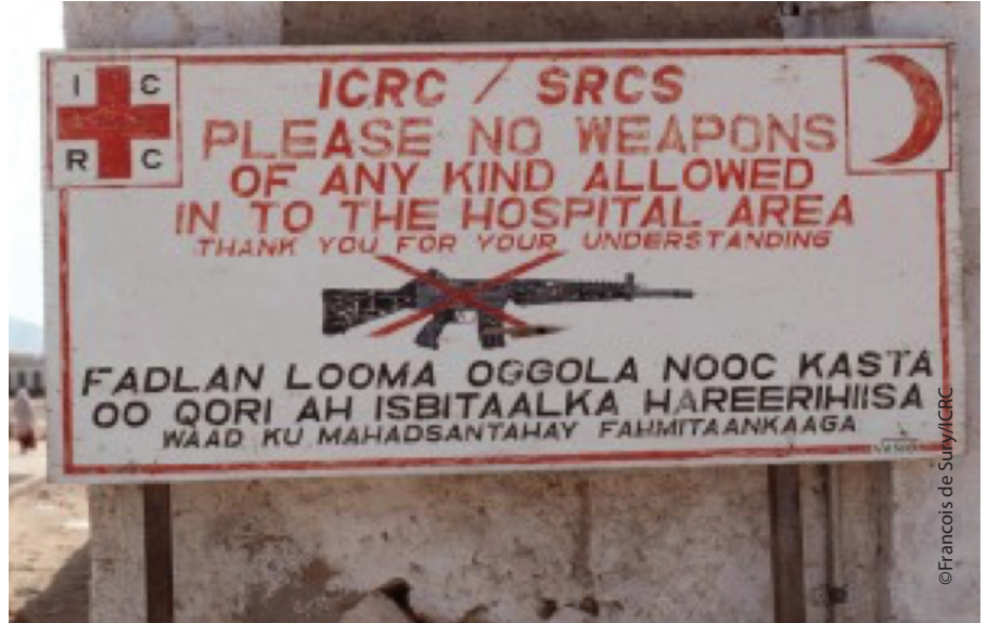
Calaamad ku taalo dibadda Isbitaalka qalliinka ee Berbera Soomaaliya oo hub ka mamnuucaya gudaha dhismaha. Tani ma aha wax aan caadi aheyn horraantii sagaashameeyadii intii lagu gudajiray dagaalkii sokeeye. Sawirka waxaa la qaaday sannadkii 1991dii.

"Marka loo socdo Keysaney" dadka waxay ka soo qaylinayaan gawaaridooda, nimanka maliisiyaadka ahna way u ogolaanayeen iyagoon isku dhibayn inay ogaadaan qabiilka uu ka soo jeedo dadka saaraan. Dadku waxay wadadaan u arki jireen mid sii fidsay dhexdhexaadnimada isbitaalka.