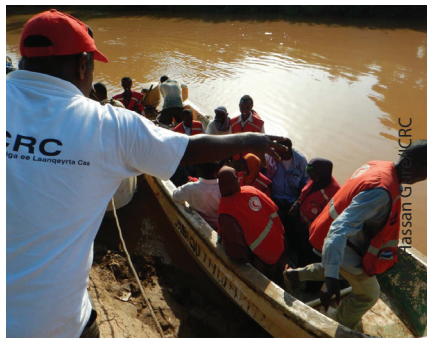
Kooxaha ICRC iyo Ururka Bisha Cas ee Soomaaliyeed waxay doon ku gaareen tuulo ku taalo Shabeelaha Dhexe si ay sameeyaan cunto qeybin. Kooxaha in ay gaaraan caqabad ayey ku aheyd sababtoo ah waddooyinka deegaanka ayaa biyo ka sare maray

Xilli roobaadka wuxuu sababay in sare u kaco webiga Shabeelle, kana dhashay fatahaad baahsan kaa oo xaaqay jidaka, go'doomiyeyna bulshooyinka sida daran u ugu dhuftay roobka. Waddooyinka biyaha ka sare maray waxay ICRC iyo SRCS u aheyd