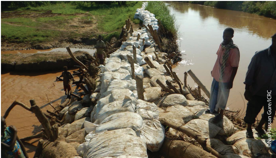
Jawaanada ciida ayaa la raseeyey jiinka Webiga Shabeelle oo ah halka biyaha ka jabsadeen. ICRC ayaa qeybisay jawaanada ciida ka hor inta usaan bilaaban roobabka Deyrta si loo maareeyo socodka webiga

Waxaa la adeegsaday doomo si loo gaaro bulshooyin hafiye biyaha daadka, Guddiga Caalamiga ee Laanqeyrta Cas (ICRC) iyo Ururka Bisha Cas ee Soomaaliyeed (SRCS) waxay in ka badan 16,000 qoysas ku nool hareeraha Webi Shabeelle waxyeelana ka soo gaartay fatahaada u qeybiyeen cunto, agabka guryaha oo lagama maarmaanka ah.