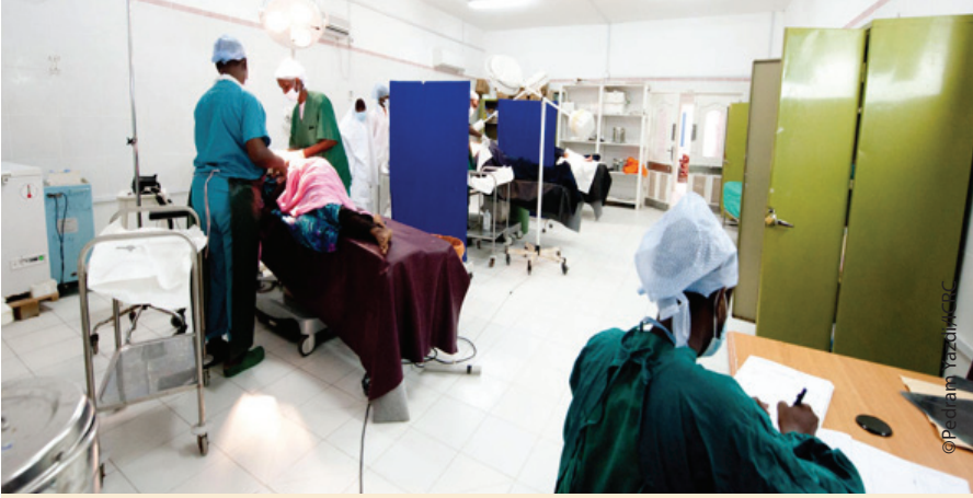
Waaxda qalliinka ee Isbitaalka Keysaney, Muqdisho.