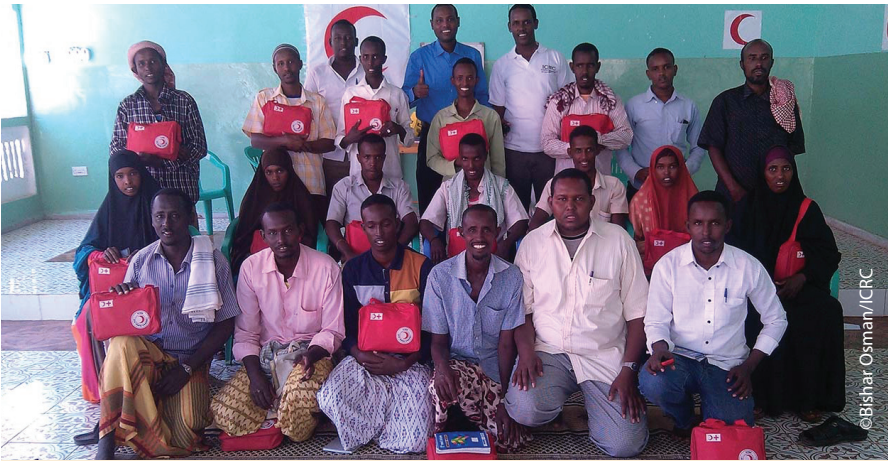
Tababarka waxaa ka qeyb qaatay dad oo laga kala keenay 12 tuulo kala geddisan ee Gobolka Galgaduud. Ka qeyb galayaasha tababarka waxay noqonaayaan kuwa ugu horreeya ee ka socda bulshada oo jawaab ka bixiya haddii ay dhacdo xaalad deg deg ah.

Dhaawacyada dadka soo gaara xilliyada colaada waxay keeni karaan naafonimo daran ama geeri haddii aan lala tacaalin waqtiga loo baahanayaahay. Gargaar deg deg oo tayeysan oo islamarkiiba goobta laga sameeyo waxay xilliyada deg dega sameyn karaan farqi u dhaxeeya nolol iyo geeri.