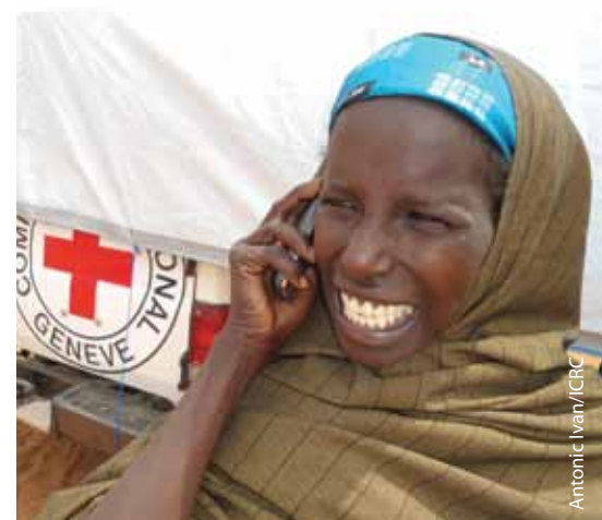
Haween yar oo Soomali ah ee ku jirta xerada qaxootiga ee Dhadhaab waxay telefoon u direysaa qoyskeeda

ayaga iyo kuwo kale oo sidooda ka faa'iideysta adeegga telefonka mobaaylka, waxay si xiiso leh u sugtaa soo yeerista xigta. La xiriirka kuwa la jecelyahay wuxuu rejo u yahay kuwa waxkastoo kale ay ka lumeen