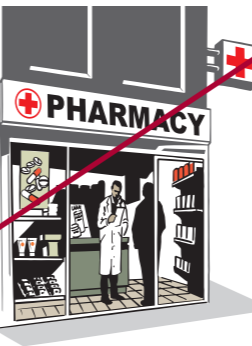
Ілюстрації: Е. Воєро

Це використання емблеми з порушенням норм міжнародного гуманітарного права. Використання емблеми установами або особами (комерційними фірмами, аптеками, лікарями приватної практики, неурядовими організаціями, приватними особами, тощо), які не мають на це повноважень, або з цілями, здатними підірвати репутацію організації або належну повагу до емблеми.