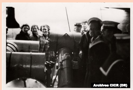
Les femmes évacuées à bord d'un torpilleur anglais

plus tôt avec les républicains et les insurgés, Junod pense pouvoir faire évacuer un groupe de 160 femmes, mais c'était sans compter qu'il lui faudrait à présent obtenir l'autorisation du nouveau président du gouvernement basque, du fait du statut d'autonomie concédé à la région le 1er octobre.