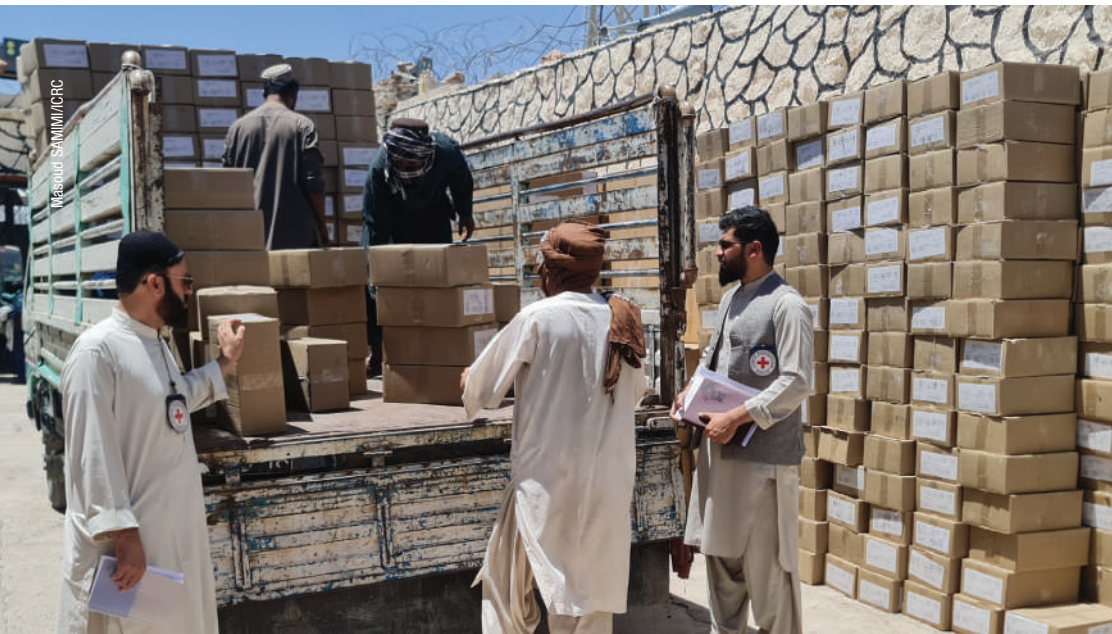
په سرپوزه ولايتي زندان کې د حفظالصحي توکو د وېش بهير