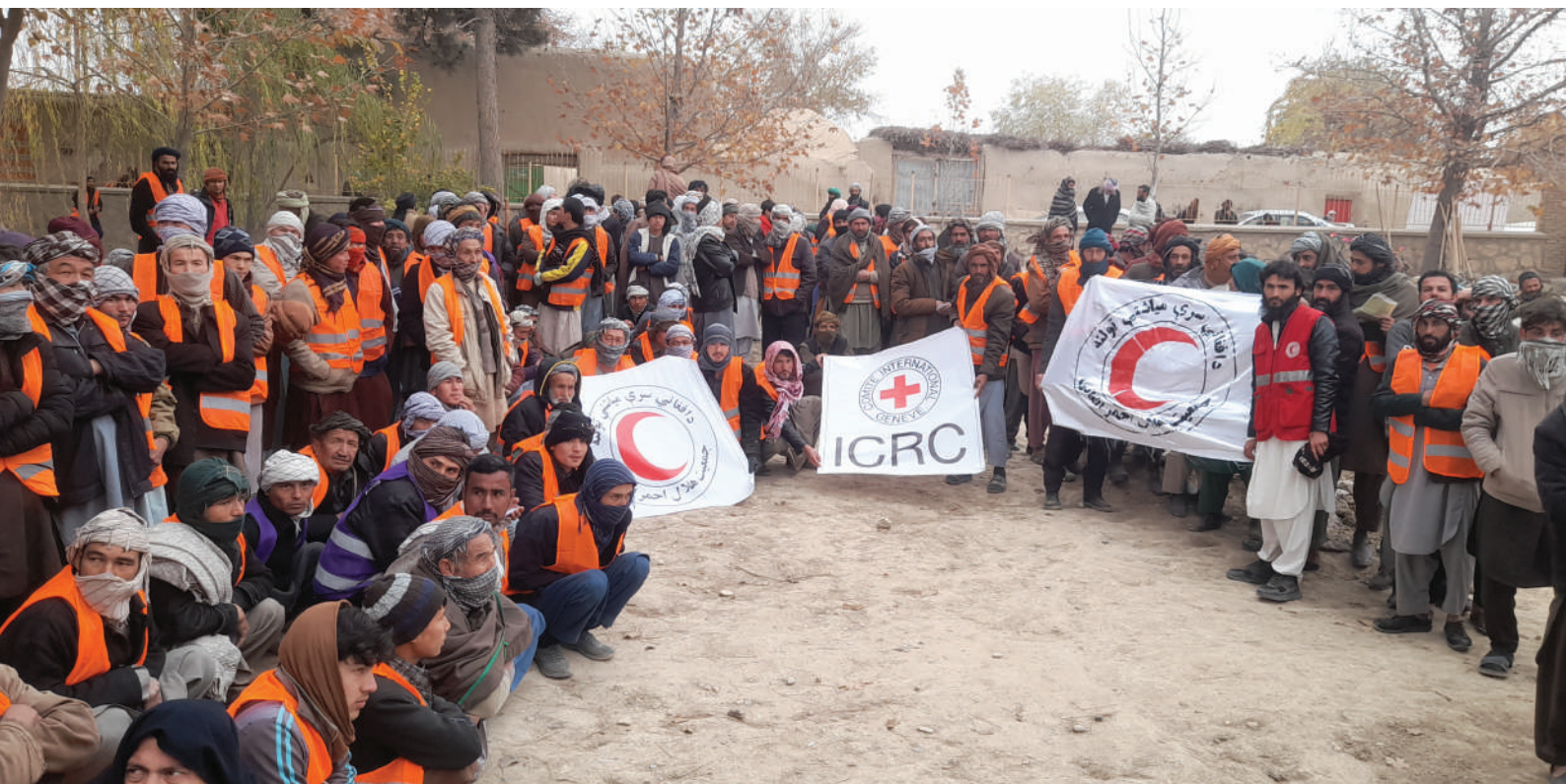
د تخار ولايت په ينگي قلعه ولسوالۍ کې د آی سي آر سي په ملاتړ د پيسو په مقابل کې د کار پروژه