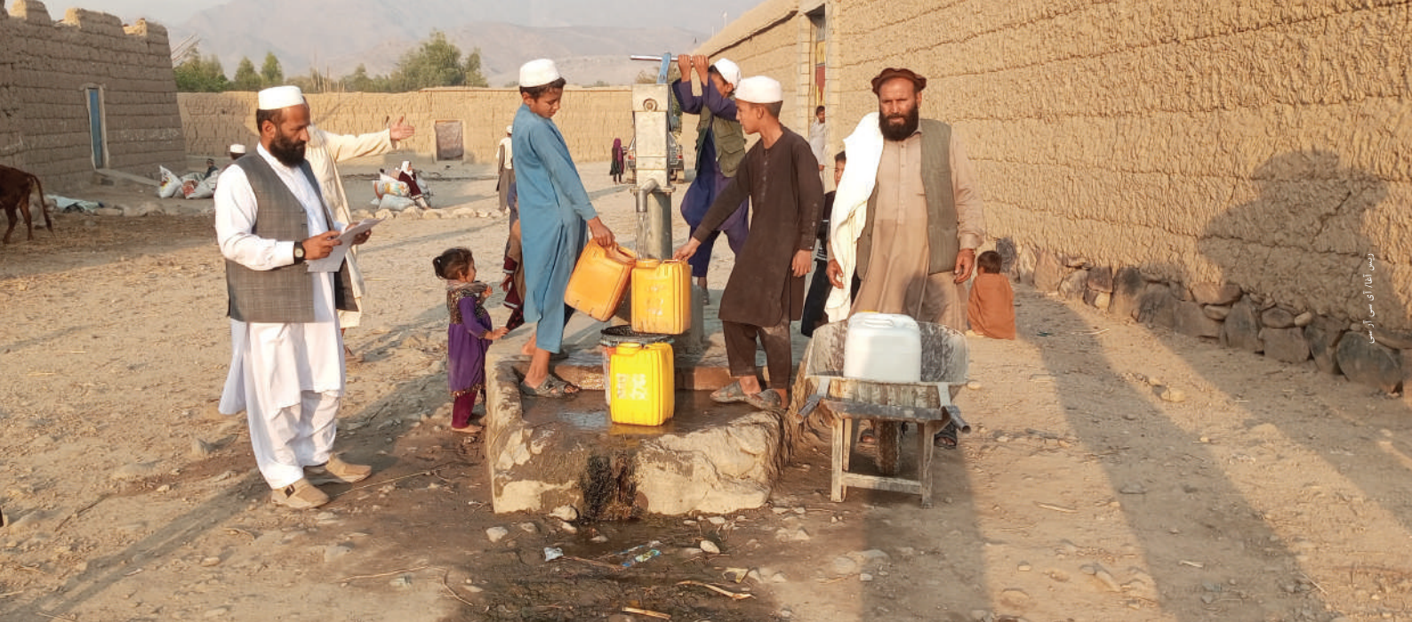
د لغمان ولايت د الينگار په ولسوالۍ كې خلك له ترميم شويو لاسي پمپونو څخه اوبه ترلاسه كوي