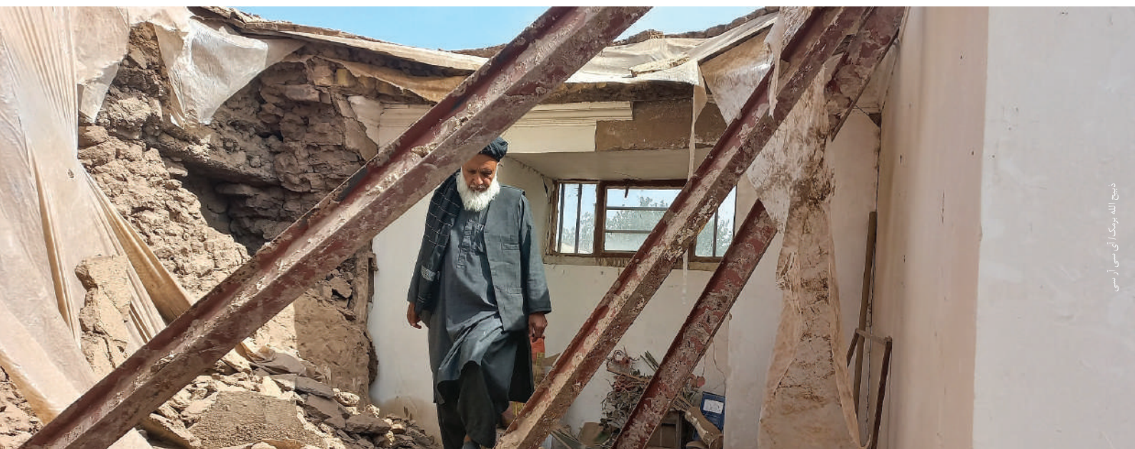
د هرات په زنده جان سيمه کې يو کس د زلزلي پرمهال د خپل ويجاړ شوي کور ليدنه کوي

د سرې مياشتې ۳۲۲ کلينيکي کارمندانو مالي او تخنيکي ملاتړ ترلاسه کړ ترڅو په گڼو روزنيزو ناستو کې گډون وکړي