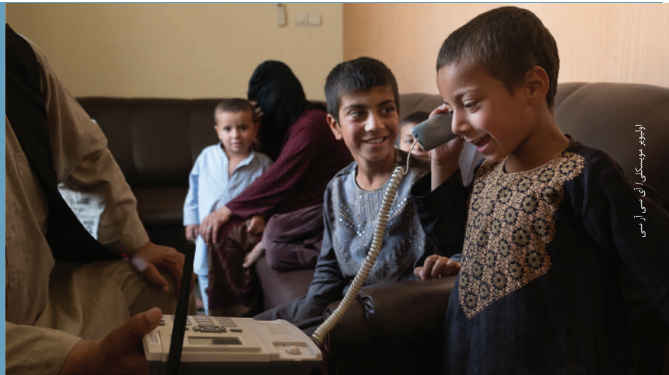
اړيکو مونسکې آی سي آر سي

يو هلک د آی سي آر سي د کورنيو اړيکو د بيا ټينگولو د چوپړ له لارې له خپل پلار سره خبرې کوي