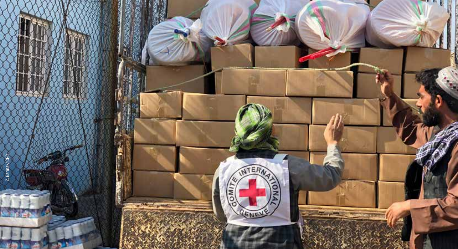
لوازم حفظ الصحوی و اشیای زمستانی مانند کمپل در محبس ولایتی هرات توزیع میگردد.