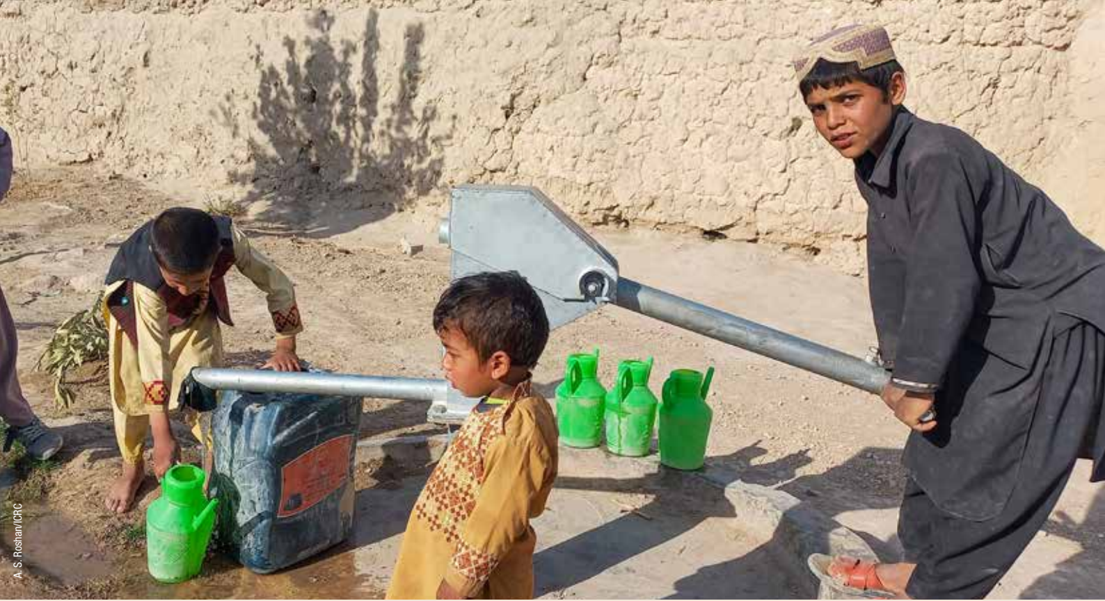
پمپ دستی آب در ساحه خرمالق فراه توسط آی سی آر سی ترمیم گردیده است تا آب پاک آشامیدنی فراهم گردد.